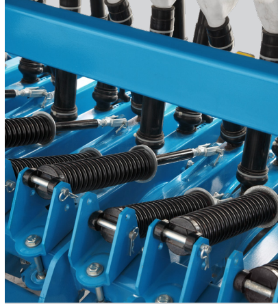
Tohum Gübre Atım Derinlik Baskı Yayı

Degree arm to adjust the throwing norm of seeds and fertilizer