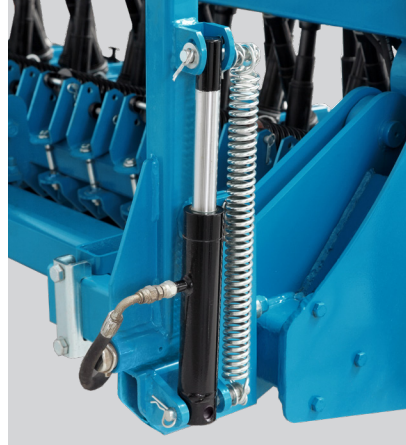
Hidrolik ve elektronik kumandalı sıra markör kolları.

Seed fertilizer spreading depth pressure spring