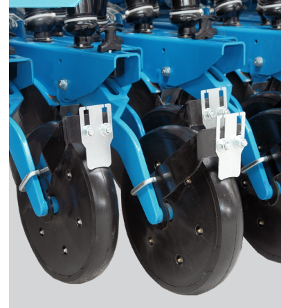
Tohum Gübre Baskı Tekerli

Row marking arms with Hydraulic and electronic controller.