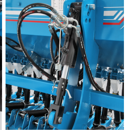
Derinlik Ayar Lift