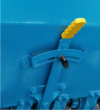
Tohum Gübre Atış Normunu Ayarlamak İçin Derece Kolu

Degree arm to adjust the throwing norm of seeds and fertilizer